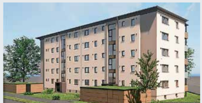
Beispielhaftes Foto des Gebäudes nach Sanierung

Eine sofortige Umlage der Modernisierungskosten auf die Mieter ist nicht geplant, weshalb die Mieterinnen und Mieter nicht mit einer Modernisierungsmieterhöhung rechnen müssen.