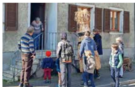
Hisgier in der alten Poststraße in Müllheim/Unterstadt

Zum Abschluss gab es im Hof der Familie Hitschler traditionell Eier mit Speck und dazu Brot von der Bäckerei Kotz. Vielleicht gibt es nächstes Jahr Kinder aus Müllheim, die mitmachen möchten und somit einen alten Brauch wieder aufleben lassen.